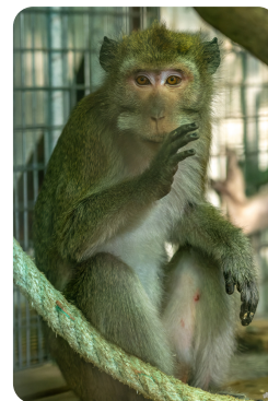
Les quatre macaques crabiers installés dans leurs nouveaux locaux aux Terres de Nataé